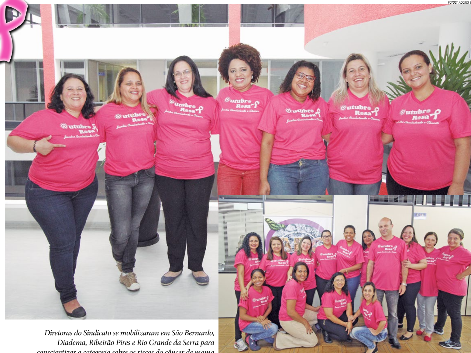
Diretoras do Sindicato se mobilizaram em São Bernardo, Diadema, Ribeirão Pires e Rio Grande da Serra para conscientizar a categoria sobre os riscos do câncer de mama